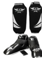
Protections Pieds et protections Tibias