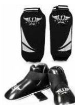
Protections Pieds et protections Tibias